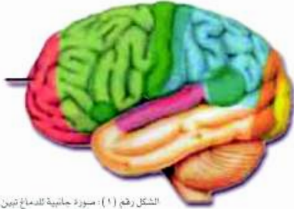
الشكل رقم (١) : صورة جانبية للدماغ تبين مقدمة الفص الأمامي (الناصية) Prefrontal area